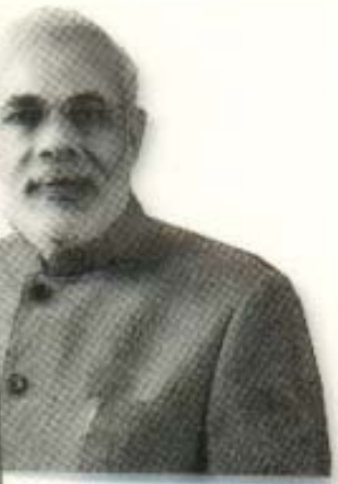
નરેન્દ્ર મોદી, પ્રધાન મંત્રી, ગુજરાત રાજ્ય

એક વર્ષ સુધી ચાલનારા સ્વર્ણિમ ગુજરાત ઉજવણી ઉત્સવમાં સહભાગી થઈએ.